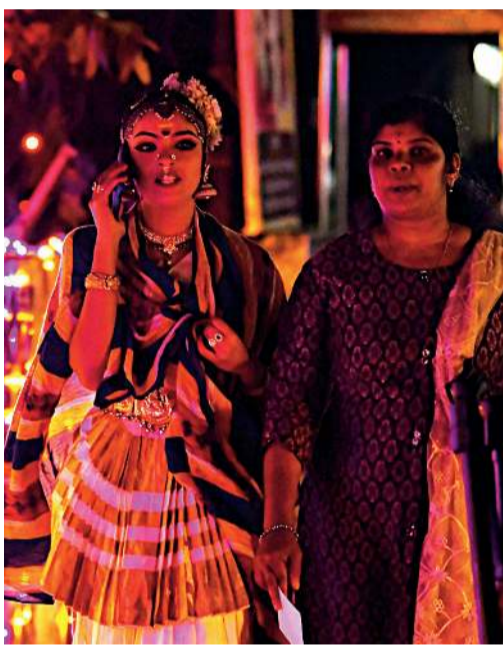
ചമയപ്പെട്ടിറങ്ങുന്നതിന് ശേഷം വേദിയ്ക്കിടയിൽ പേരുകേട്ട ഹോണിനിയോ മത്സരാർഥി.

സാമൂഹ്യവിമർശനത്തിന്റെ കുരമ്പായി തുള്ളൽപിന്നെ മണ്ണിൽ കലയുടെ തുള്ളിയാട്ടുമായി കലാലയ യുവനം. കുഞ്ചൻ നമ്പ്യാരുടെയും തകഴിയുടെയും കർമ്മദ്രുമിയായ അമ്പലപ്പുഴയുടെ മണ്ണിൽ ആദ്യമായിട്ടായി സർവകലാശാല യുവജനോത്സവത്തെ ഹൃദയത്തിൽ ഏറ്റുവാങ്ങി നാട്. കിഴക്കിന്റെ വെനീസിന് ഇനി കലയുടെ പകലിരവുകൾ