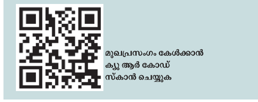
മുഖപുസ്തകം കേൾക്കാൻ കൂടുതൽ കോഡ് സ്കാൻ ചെയ്യുക

കൂടുതൽ ആളെ കയറ്റി, നിശ്ചയിച്ച സമയം കഴിഞ്ഞ് സർവീസ് നടത്തിയത് പൊതുജനസൗകര്യം നൽകുന്നതിനായി. എന്തായാലും മനുഷ്യജീവനുകൾ വെട്ടി ഇനിയും പന്താടാൻ ആരെയും അനുവദിക്കരുത്. ബോട്ടുകൾക്ക് ലൈസൻസ് നൽകുമ്പോഴും ഫിറ്റിംഗ് സർട്ടിഫിക്കറ്റ് നൽകുമ്പോഴും ഉള്ള കർശന നിബന്ധനകൾ ഉടമകൾ പാലിക്കുന്നുണ്ടോ എന്ന് ഉറപ്പുവരുത്തേണ്ടതുണ്ട്