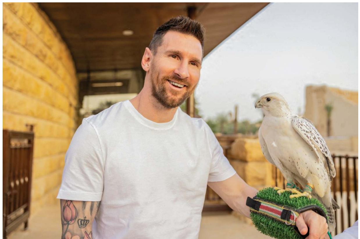
ഈ മാസമാറ്റം നടത്തിയ സൗദി സമരശക്തികൾ റൊണാൾഡോയ്ക്ക് വലിയ തുകയ്ക്ക് മെസിക്ക് വാഗ്ദാനം ചെയ്തു