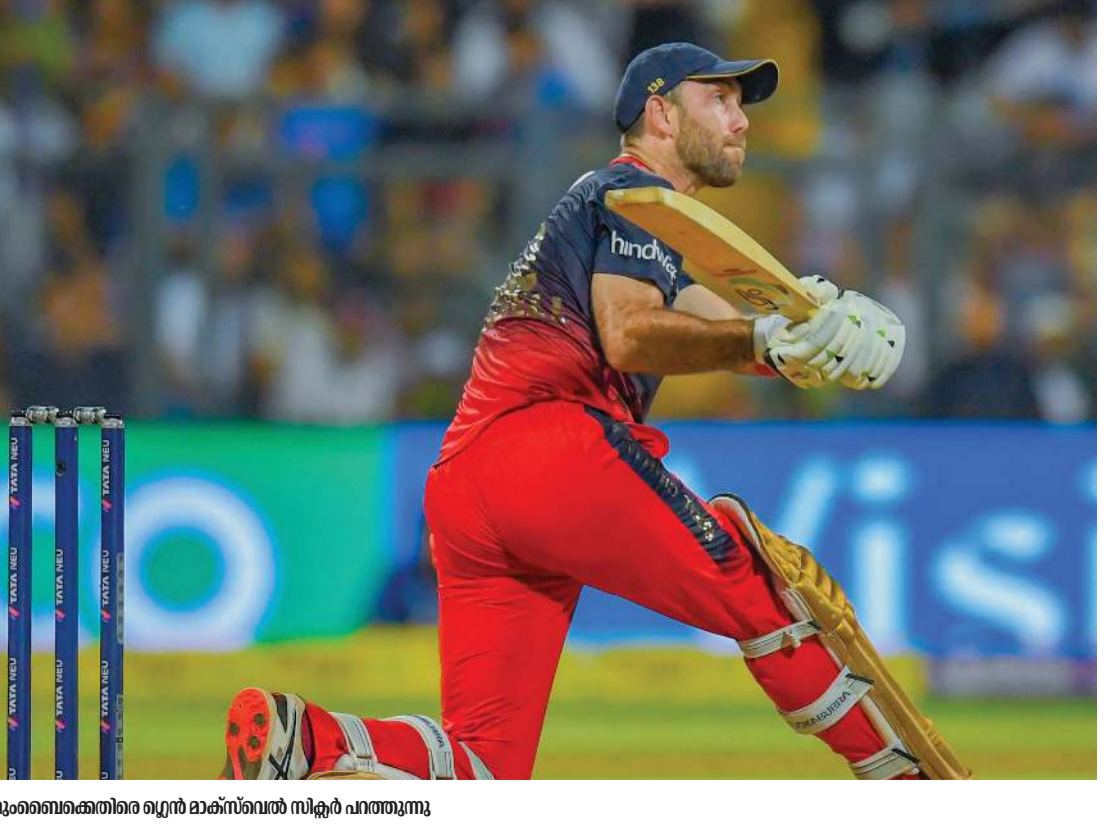
മുംബൈക്കെതിരെ റ്റേൻ മാക്സ്വെൽ സിക്സർ പന്തെടുത്തു