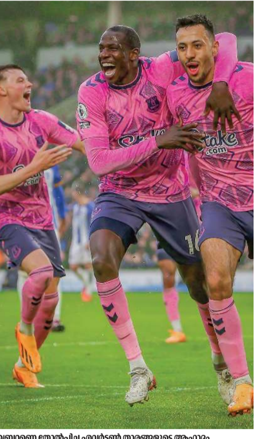
ബ്രെന്റ്ഫോർഡ് നോർപ്പിള എവർട്ടൺ താരങ്ങളുടെ ആഘോഷം

ലണ്ടൻ ഇംഗ്ലീഷ് പ്രീമിയർ ലീഗിൽ മൂന്ന് കളിയിൽ പിറന്നത് 21 ഗോൾ. പ്രമുഖ ക്ലബ്ബുകളുടെ മത്സരങ്ങൾ അല്ലാതിരുന്നിട്ടും ഗോളുകൾ കൂറുവണ്ടായില്ല. ബ്രെന്റ്ഫോർഡ് തോൽവിയായിരുന്നു ഇതിൽ പ്രധാനം. ബ്രെന്റ്ഫോർഡ് 1-എവർട്ടൺ തകർത്തു. ഫുൾഹാം ലെസ്റ്റർ സിറ്റിയെ കീഴടക്കിയത് 5-3ന്. നോട്ടിങ്ഹാം ഫോറസ്റ്റ് 4-3ന് സതാംപ്റ്റൺ കീഴടക്കി. ബ്രെന്റ്ഫോർഡിന്റെ യൂറോപ യോഗ്യതാ പ്രതീക്ഷകളെ തകർത്താണ് എവർട്ടൺ കൂറ്റൻ ജയം സ്വന്തമാക്കിയത്. 55 പോയിന്റുമായി ബ്രെന്റ്ഫോർഡ് ഏഴാമതാണ്. എവർട്ടൺ പതിനേഴാം സ്ഥാനത്താണ്. മൂന്ന് കളി ശേഷിക്കെ എവർട്ടൺ താൽക്കിലകമായി താരങ്ങളുടെ മേഖലയിൽനിന്ന് രക്ഷപ്പെട്ടു. ലെസ്റ്റർ, ലീഡ്സ്, സതാംപ്റ്റൺ ക്ലബ്ബുകൾ താരങ്ങളുടെ മേഖലയിലുള്ളത്.