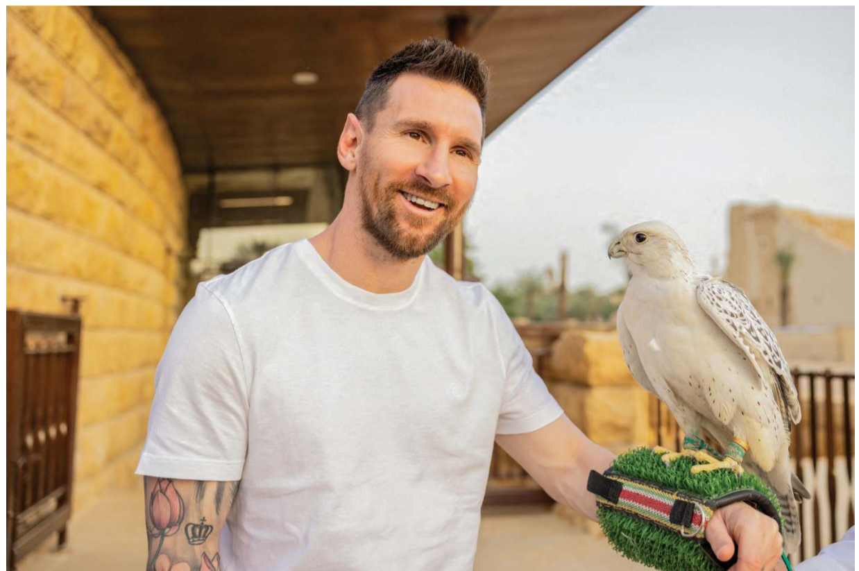
ഈ മാസമാറ്റം നടത്തിയ സൗദി സമർപ്പണത്തിനും നിയമിത പാൽക്കമ്പുമായി നിൽക്കുന്ന മെസി

ബാഴ്സലോണ വിട്ട് പിഎസ്ജിയിലെത്തിയ മെസിക്കി പ്രതീക്ഷിച്ച കളിജീവിതമല്ല കിട്ടിയത്. അവസാനഘട്ടത്തിൽ കാണികൾ എതിരായി. ഒരു വർഷംകൂടി കരാർ നീട്ടുമെന്നായിരുന്നു ലോക കപ്പിനുമുന്നുള്ള സൂചന. എന്നാൽ, ഫ്രാൻസിനെ കിഴക്കി അർജന്റീനയെ ലോക ചമ്പ്യൻമാരാക്കി തിരിച്ചെത്തിയ മെസിക്കി നല്ല വരവേൽപ്പല്ല കിട്ടിയത്. ഇതിനിടയ്ക്കാണ് അനുമതിയില്ലാതെ സൗദിയിലേക്ക് യാത്ര ചെയ്തതിന് പിഎസ്ജി വിളക്ക് ഏർപ്പെടുത്തിയത്. എന്നാൽ, ക്ലബ്ബിലേക്കു കാലാവധി ചുരുക്കി. മുപ്പത്തഞ്ചു കാരൻ ക്ലബ്ബിൽ പരിശീലനം നടത്തുകയും ചെയ്തു. ടിമിനെ ലീഗ് ചമ്പ്യൻമാരാക്കി അവസാനിപ്പിക്കാനാണ് തീരുമാനം. ഏതായാലും പിഎസ്ജി വിട്ടുപോകാൻ തീരുമാനമായിട്ടുണ്ട്. ഈ സാഹചര്യത്തിലാണ് അൽ ഹിലാൽ വമ്പൻ വാഗ്ദാനവുമായെത്തിയത്. കഴിഞ്ഞമാസം തുടക്കംമുതൽ അൽ ഹിലാൽ രംഗത്തുണ്ട്. ക്രിസ്റ്റ്യാനോ റൊണാൾഡോ കളിക്കുന്ന അൽ നാസർ ക്ലബ്ബിന്റെ മുഖ്യ എതിരാളിയാണ് അൽ ഹിലാൽ.