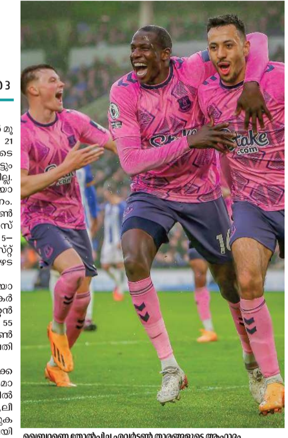
ബ്രെന്റഫോർട്ട് നോർവുച്ചി എവർട്ടൺ താരങ്ങളുടെ ആവേശം

ലണ്ടൻ ഇംഗ്ലീഷ് പ്രീമിയർ ലീഗിൽ മൂന്ന് കളിയിൽ പിറന്നത് 21 ഗോൾ. പ്രമുഖ ടീമുകളുടെ മത്സരങ്ങൾ അല്ലാതിരുന്നിട്ടും ഗോളടിയുടെ കുറവുണ്ടായില്ല. ബ്രെന്റഫോർട്ട് തോൽവിയാണിരുന്ന ഇതിൽ പ്രധാനം. ബ്രെന്റഫോർട്ട് 5-ന് എവർട്ടൺ തകർത്തു. ഫുൾഹാം ലെസ്റ്റർ സിറ്റിയെ കീഴടക്കിയത് 5-3ന്. നോട്ടിങ്ഹാം ഫോറസ്റ്റ് 4-3ന് സതാംപ്റ്റൺ കീഴടക്കി. ബ്രെന്റഫോർട്ട് യൂറോപ യോഗ്യതാ പ്രതീക്ഷകളെ തകർത്താണ് എവർട്ടൺ കൂറ്റൻ ജയം സ്വന്തമാക്കിയത്. 55 പോയിന്റുമായി ബ്രെന്റഫോർട്ട് ഏഴാമതാണ്. എവർട്ടൺ പതിനേഴാംസ്ഥാനത്തും. മൂന്ന് കളി ശേഷിക്കെ എവർട്ടൺ താൽക്കിലകമായി തരംതാഴ്ന്നു മേലിലായി നിന്ന് മക്ഷപ്പെട്ടു. ലെസ്റ്റർ, ലീഡ്സ്, സതാംപ്റ്റൺ ടീമുകളാണ് തരംതാഴ്ന്നു മേലിലായി ലുള്ളത്.