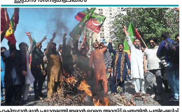
പാകിസ്ഥാൻ മുൻ പ്രധാനമന്ത്രി ഇന്ദ്രാൻ ഖാനെ അറസ്റ്റ് ചെയ്യുന്നതിൽ പ്രതിഷേധിച്ചു.

ഇന്ദ്രാൻ അറസ്റ്റിൽ പാകിസ്ഥാനിൽ കലാപം. അഴിമതിക്കേസിൽ വിചാരണ നേരിടാൻ എത്തിയ പാകിസ്ഥാൻ മുൻ പ്രധാനമന്ത്രി ഇന്ദ്രാൻ ഖാനെ കോടതിയിൽ അറസ്റ്റ് ചെയ്തു. പിന്നാലെ രാജ്യമെമ്പാടും പ്രതിഷേധം ശക്തമാക്കി ഇന്ദ്രാന്റെ ഇരട്ടിയായ പാകിസ്ഥാൻ ടൈംസ് ഇന്ദ്രാൻ ഖാൻ (പിടിപി). ഇന്ദ്രാൻ ഖാൻ, പെഷാവർ എൻവിടങ്ങളിൽ നിരോധനാജ്ഞ പ്രഖ്യാപിച്ചു. ലാഹോറിൽ പ്രക്ഷോഭം സൈനിക കമാൻഡിന്റെ വീട് തകർത്തു. റാവിലിംഗിലായിട്ട് സൈനിക ഹെൽപ്പർട്ടിൽ അതിക്രമിച്ച് കയറി. കെറ്റിയിൽ സൈനിക ചെക്ക് പോസ്റ്റ് തകർത്തു. വിവിധയിടങ്ങളിൽ പൊലീസ് മർദ്ദനം ഏറ്റുമുട്ടലുണ്ടായി. കരാച്ചി ഉൾപ്പെടെ പ്രധാന നഗരങ്ങളിലെല്ലാം ഗതാഗതം തടസ്സപ്പെട്ടു. സൈന്യം തന്നെ വധിക്കാൻ പദ്ധതിയിടുന്നതായി തിങ്കളഴ്ച ഇന്ദ്രാൻ ആരോപിച്ചിരുന്നു.