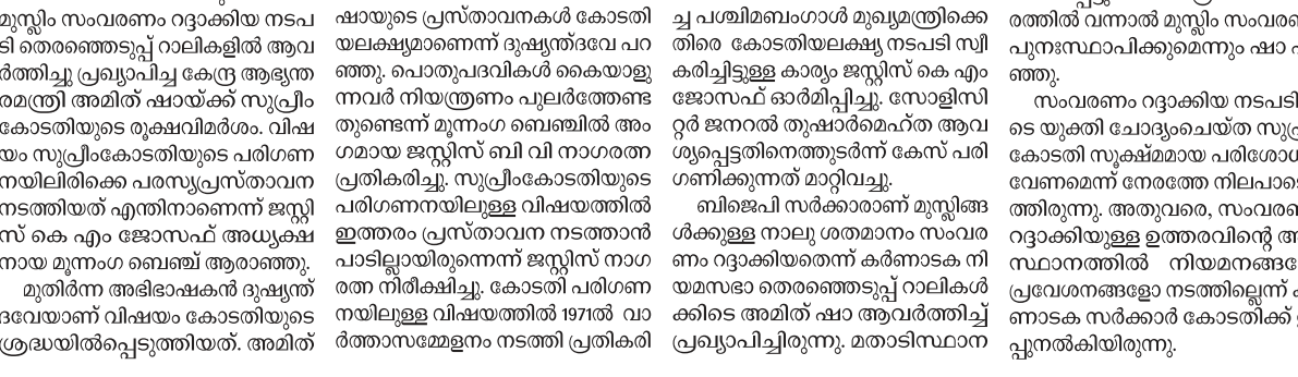
അമിത് ഷായ് സുപ്രീംകോടതിയുടെ രൂക്ഷവിമർശം

മുസ്ലിം സംവരണ വിരുദ്ധ പ്രസ്താവന. അമിത് ഷായ് സുപ്രീംകോടതിയുടെ രൂക്ഷവിമർശം. അമിത് ഷായ് സുപ്രീംകോടതിയുടെ രൂക്ഷവിമർശം. അമിത് ഷായ് സുപ്രീംകോടതിയുടെ രൂക്ഷവിമർശം.