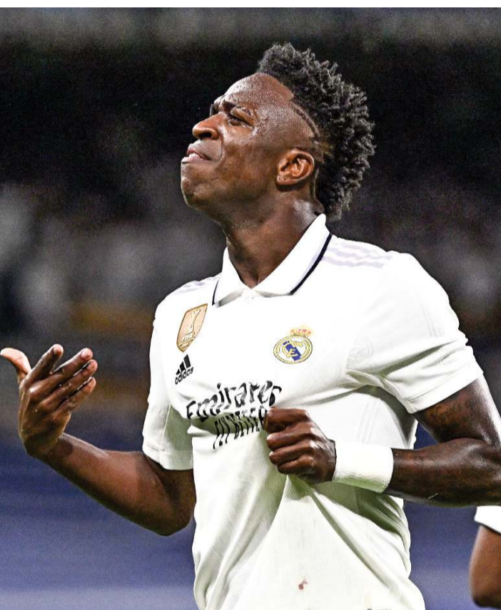
റയലിനായി ഗോൾ നേടിയ വിനിഷ്യസിന്റെ ആഹ്ലാദം

ചമ്പ്യൻ ലീഗിൽ റയൽ മാഡ്രിഡ് - ചാമ്പ്യൻസി റിപ്പോർട്ടർ സിറിയ റെഡ് 1-1 റയലിനായി വിനിഷ്യസ് ലക്ഷ്യം കിണ്ടി ഡി ബ്രയ്ക്ക് സിറിയക്ക് സമനിലയൊരുക്കി രണ്ടാംപാദം 16ന്