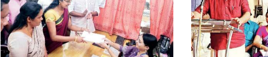
കാനന നാർഡ് എൽ.ഡി.എഫ്. സ്ഥാനാർത്ഥി പത്രിക നൽകുന്നു. ഇടത് മുതൽ: നഗരസഭ ഉപതസ്തു മേഖല വി. വി. തോട്ടം, മെന്റർ ഇൻസ്പെക്ഷൻ, മേണ്ഡർ സാർവ്വജനിക, മേണ്ഡർ സാർവ്വജനിക, മേണ്ഡർ സാർവ്വജനിക.