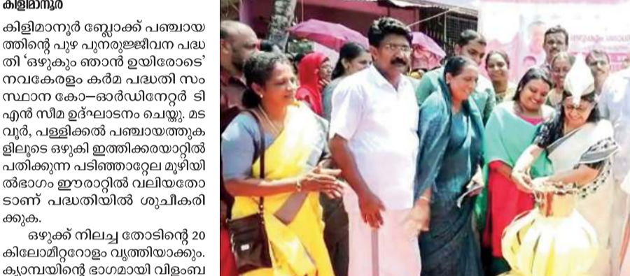
ഔദ്യോഗികമായി 'ഒഴുക്കും തൊൻ ഉയിരോടെ' പദ്ധതിക്ക് തുടക്കം നൽകി. ഇടത് മുതൽ: നഗരസഭ ഉപതസ്തു മേഖല വി. വി. തോട്ടം, മെന്റർ ഇൻസ്പെക്ഷൻ, മേണ്ഡർ സാർവ്വജനിക, മേണ്ഡർ സാർവ്വജനിക, മേണ്ഡർ സാർവ്വജനിക.