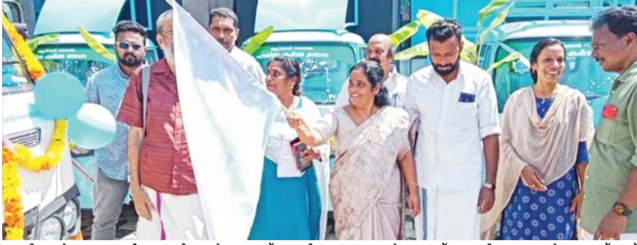
ആറ്റുങ്ങൽ നഗരസഭയിലെ പരിതെ കർമ്മസേനയ്ക്ക് വാഹനങ്ങളും ഉപകരണങ്ങളും കൈമാറി. ഇടത് മുതൽ: നഗരസഭ ഉപതസ്തു മേഖല വി. വി. തോട്ടം, മെന്റർ ഇൻസ്പെക്ഷൻ, മേണ്ഡർ സാർവ്വജനിക, മെന്റർ ഇൻസ്പെക്ഷൻ, മേണ്ഡർ സാർവ്വജനിക, മേണ്ഡർ സാർവ്വജനിക.