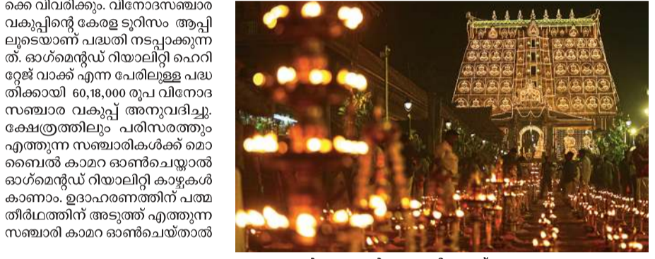
പരമനാഭസ്വാമി ക്ഷേത്രത്തിലെ ലക്ഷദ്വീപ് കാഴ്ച

തിരുവനന്തപുരം സഞ്ചാരികൾക്ക് ഇനി ഓഗ്സ്റ്റെൻഡ് റിയാലിറ്റി (എആർ) സാങ്കേതികവിദ്യയുടെ സഹായത്തോടെ പരമനാഭസ്വാമിക്ഷേത്രത്തിലെ വിസ്മയകാഴ്ചകൾ ആസ്വദിക്കാം. ക്ഷേത്രപരിസരത്ത് എത്തിച്ചേർന്നാൽ കാമറ ഓൺചെയ്താൽ ലക്ഷദ്വീപിന്റെയും ആറ്റാട്ടിന്റെയും മനോഹര കാഴ്ച സ്ക്രീനിൽ തെളിയും. ഒപ്പം ക്ഷേത്രത്തിന്റെ ചരിത്രവും പ്രത്യേകതകളുമെ