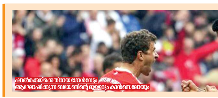
പാൽക്കെയിക്കൊന്നായ ഗോൾസ്കോർ ആഘോഷിക്കുന്ന ബയേണിന്റെ മുഖമുഖം കാൻസെസലയും

ണിൽ കിരീടത്തിലേക്ക് അടുക്കാനായില്ല. നയലാണ് നിലവിലെ ചാമ്പ്യൻമാർ. മെസി ക്ലബ്ബ് വിട്ടതിനുശേഷമുള്ള ആദ്യ കിരീടമാകും ബാഴ്സയ്ക്ക്. ഈ സീസണോടെ ക്ലബ്ബ് വിട്ടു നെർജിയോ ബുസ്കെറ്റ്സിനാകും സാവി കിരീടം സമർപ്പിക്കുക. 18 വർഷമാണ് ഈ മധ്യനിരക്കാരൻ ടീമിലുണ്ടായിരുന്നത്. 718 കളിയിൽ ഇറങ്ങി. സാവിക്ക് ആദ്യ ഇനി യേസ്റ്റുകൊണ്ട് കിഴിത് പ്രതിരോധത്തിന്റെ കൂടി ചുമതല വഹിച്ചു മധ്യനിര താരം. ബുസ്കെറ്റ്സിനുശേഷം ബാഴ്സയിൽ മറ്റൊരു യുഗം ആരംഭിക്കുമെന്നായിരുന്നു സാവിയുടെ പ്രതീകരണം. 'കണ്ടതിൽവെച്ചുള്ള ഏറ്റവും മികച്ച പ്രതിരോധ മധ്യനിരക്കാരനാണ് ബുസ്കെറ്റ്സ്. ആ യുഗം അവസാനിച്ചു. ഇനി പുതിയൊരു യുഗം. പെഡ്രിയും ഗാവിയും ടീമിന്റെ മധ്യനിര ഏറ്റെടുത്തിരിക്കുന്നു-സാവി പറഞ്ഞു.