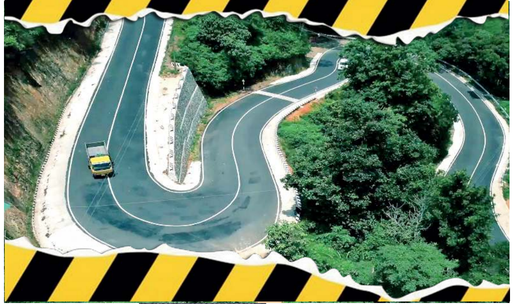
പീരുമേട്-ദേവികുളം മലയോര ഹൈവേ

കോടി രൂപയിൽ 18.3 കിലോമീറ്ററിലാണ് റോഡ് നിർമ്മിച്ചത്. 12 മുതൽ 13.5 മീറ്റർ വരെയെണ്ണിയാണ്. ഏഴു മീറ്റർ കാര്യേച്ഛ വേയും ഇരുവശങ്ങളിലും ഒരു മീറ്റർ വീതി പേവ്ഡ് ഷോൾഡറുകളുമുണ്ട്. സംരക്ഷണത്തിൽ, കല്ലുകൾ, നടപ്പാത, മറ്റ് റോഡ് സുരക്ഷാസംവിധാനം ഉൾപ്പെടെ ആധുനിക നിലവാരത്തിലാണ് നിർമ്മാണം പൂർത്തിയാക്കിയത്.